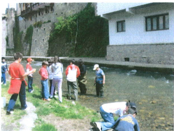
Grupo del PROA en el Río

Redacción.- Los Alumnos y alumnas del Plan Proa se desplazaron hace unas semanas hasta uno de nuestros cercanos ríos, el Quiviesa, para realizar diversas actividades acompañados por su monitora.